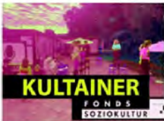
SEPTIMBER 2016 GESCHICHTSWIRTSCHAFT, KULTURBEI, PROJEKTE KULTAINER