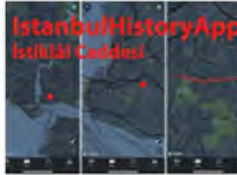
DIGITALEN-TÜRKSCHEN JUGENDBRÜCKE, HISTORY, HISTORY APP, ISTANBUL, ISTANBULKUNSTHISTORIE, KÜRSER ISTANBULHISTORYAPP