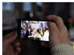
BÜROKREISLAUFUNG, DIGITALEN-TÜRKSCHEN JUGENDBRÜCKE, GESCHICHTSWIRTSCHAFT