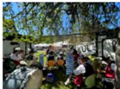
KUNSTBEREICHKULTUR, KUNSTBEREICH, PROJEKTE, SOZIOKULTUR KULTAINER IN GRENZENBEREICH