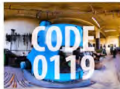
ART-NEUSTELLUNG, KUNSTBEREICH, DIGITALE PROJEKTE, PROJEKTE CODE 0-119