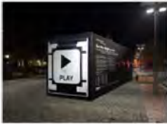
NEUSTELLUNG, KUNSTBEREICHKULTUR, GEDRUCKTE KUNST, GESCHICHTSWIRTSCHAFT, HISTORY SET THE NIGHT ON FIRE