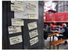
MASSBARE, SOZIOKULTUR, ZWISCHENBEREICH LABOR FÜR EUROPÄISCHE GESCHICHTE - RUNDHAUS EUROPA