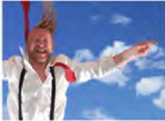
DOCUMENTARY, DOCUMENTATION, FILM, THEATER, THEATRE KUBR GAG ARTVIDEO PROJEKT