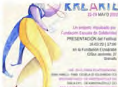
ERKENNTNIS, ERKENNTNIS, ERKENNTNIS, THEATER, SOCIAL SERVICES KALARIK