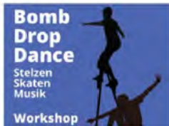
LEBENSSTIL, KUNST MACHT STARK, THEATER, THEATRE, WORKSHOPS BOMBEDROPDANCE - TANZ UND THEATER MIT STELZEN UND SKATEERN