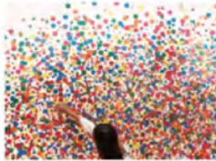
FRANZÖSISCH, EXPERTISE, SCHNITT, KACHARAFESTUNGSKUNST, GRAFFITI, REINHEIT ART NO STOP: SOCIAL WORLD FOR ART