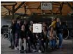
DIAGNOSTIK, DIGITALE PROJEKTE, ERKENNTNIS, ERKENNTNIS, SPEZIFISCHE JUGENDKUNST, PROJEKTE, REINHEIT, SOZIOKULTUR, YOUTH ACTORS IN EUROPE, YOUTH PROJECT DIE FLOTT: VIRTUELLES RÜCKSACKRÜCKEN