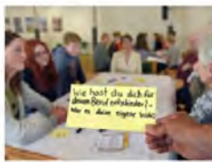
ART: TABLE DE NEGOCIACION, DIALOGUEMANA, TISCH DER GENERATIONEN TISCH DER GENERATIONEN (ZWEITES UNTERSUCHUNGSPROJEKT)