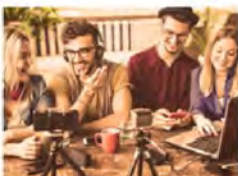
ART-NEUSTELLUNG, DIGITALEN-TÜRKSCHEN JUGENDBRÜCKE, DIGITALE PROJEKTE, DIGITALEN-TÜRKSCHEN JUGENDBRÜCKE