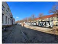
BÜROKREISLAUFUNG, COOPERATION, KULTURBEI, FREIZEIT, SOZIOKULTUR, STADTBILDAU PLANUNGSRAUM II