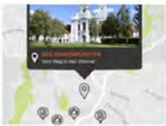
ART: INTERAKTIV, MEDIEN BAYERN-HISTORY APP