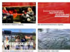
FILM UND VIDEO, STEUERUNG, THEATER UNTERS FILMPROJEKTE AUF VIDEOBEI UND VIDEO