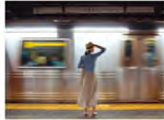
BÜROKREISLAUFUNG, EUROPA, EUROPA ZEITREISE EUROPA - INTERBIL